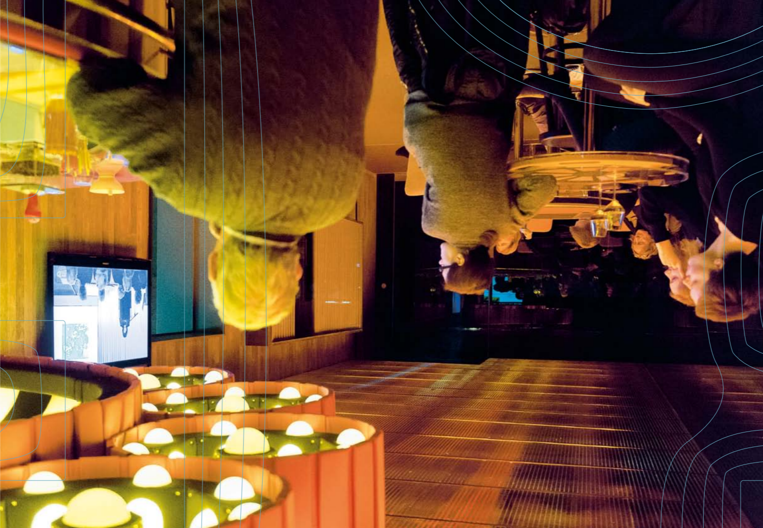
2-3 Schmela Haus 2015 Fotos: Katja Illner, Düsseldorf 2015