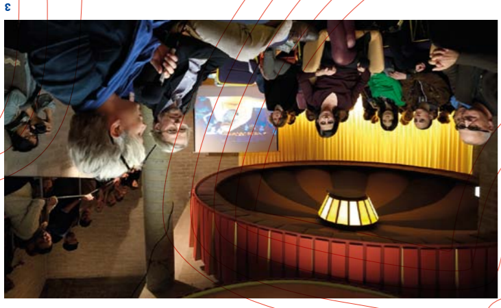
Admission free of charge. Limited seating. Sorry, no reservations.